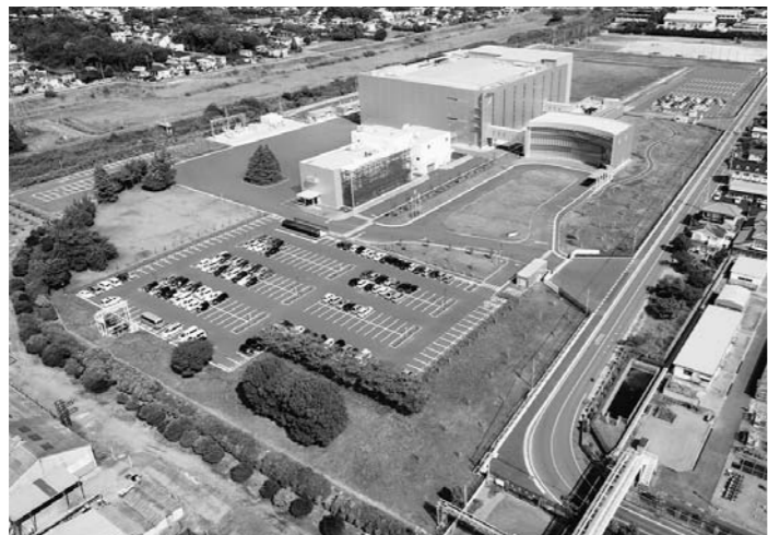
製造能力向上が進む沢井製薬の関東工場

4月の薬価制度の改定では、初収載時のジェネリックの基本薬価が従来の先発品の7割から6割に引き下げられた。先発品と比較して低価格とい