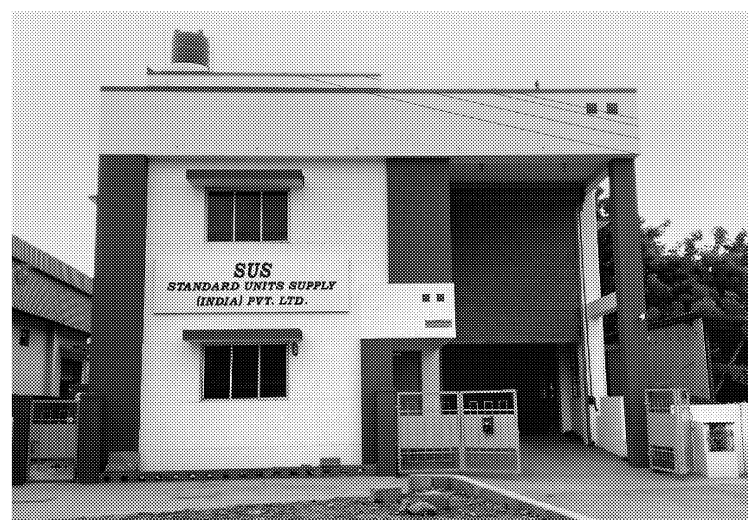
6月に営業活動を始めたSUSのインド販社

静岡ガスは全額出資の電力事業会社「静岡ガス&パワー」(静岡県富士市)を設立、電力事業に参入する。総合エネルギー事業推進の一環。静岡県東部地区に自前の発電設備を建設するほか、地域内の工場や再生可能エネルギーの余剰電力を購入する。自社電源の規模は約1万5000kw、供給規模は計3万kwで立ち上げる予定。県東部地区の小規模工場や業務用ビル向けなどに、16年