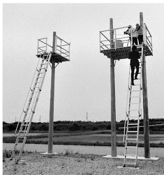
トフ防炎の家庭用津波避難タワー

防災用品販売のトフ防炎(静岡県袋井市)は、市販されている電柱を利用した低価格で省スペースな津波避難設備「家庭用津波避難タワー」を発売した。東日本大震災で津波被害にあった被災地で電柱が流されずに残っていたことにヒントを得て開発。避難時間が少ない沿岸部の家や、小規模事業者など向けの一時避難場所として売り込む。電柱一本を使った高さ6.5m、避難可能人数5人のタイプで、価格は工事費込みで11.8万円(消費税抜き)。年販10台を目標とする。