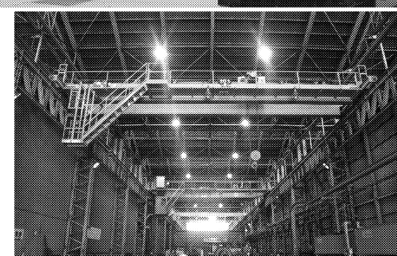
■ クレーン設計施工 ■ 労働局クレーン製造許可工場 ■ 大労安許第191号