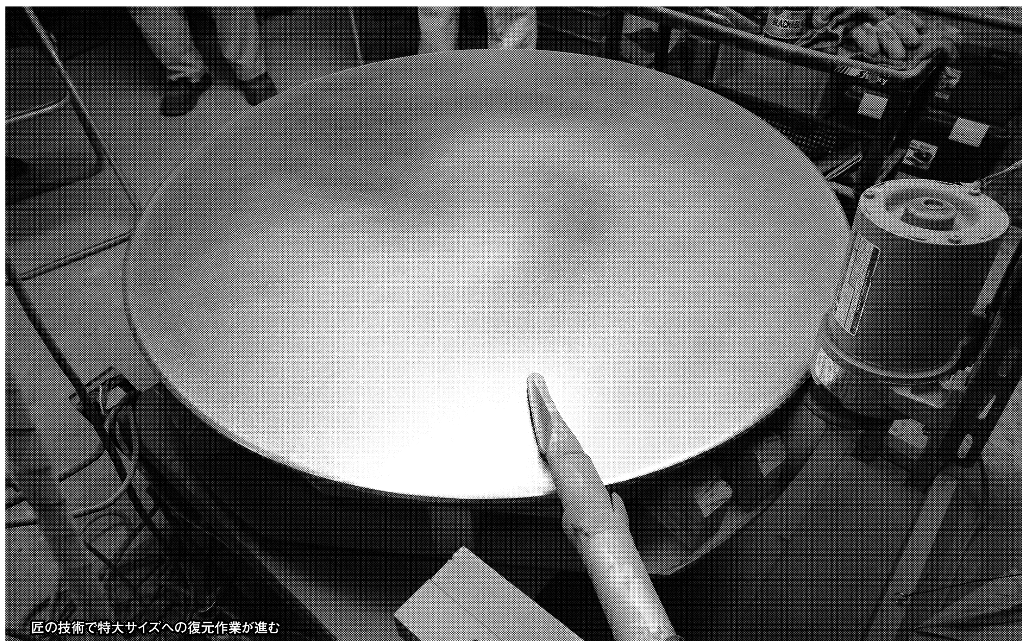
匠の技術で特大サイズへの復元作業が進む