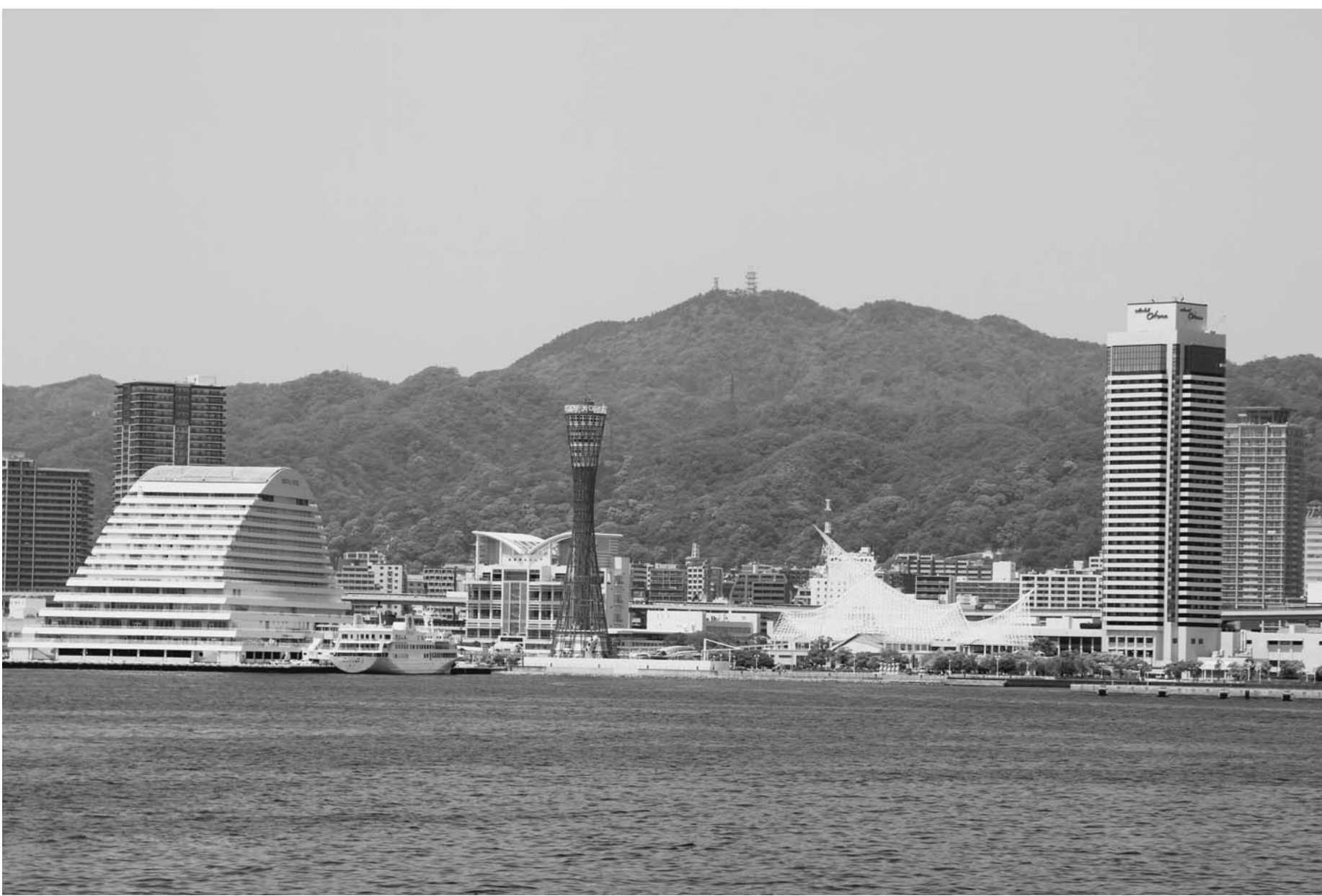
▶ポートアイランドからメリケンパーク周辺を望む

所からはスーパーコンピュータ「京」の100倍の演算性能を持つ次世代スパコン「エクサ級」の神戸への設置も決まった。特区による規制緩和や次世代スパコン設置は、直接、中小企業に跳ね返るものではないが、95年1月17日の阪神・淡路大震災以来、復興を図ってきた兵庫・神戸にとって好材料であり、今後のモノづくりを支える大きな力になる。中小企業の若手社員がスパコンを気軽に活用して自社製品を開発するのが当たり前になる日も決して遠くはないだろう。兵庫・神戸が日本に元氣を取り戻し、新たなモノづくりを進めて行く。