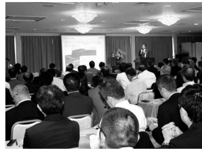
昨年のセミナーの様子