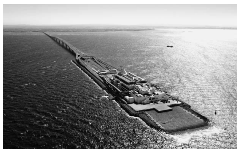
値下げ継続が決まったアクアライン

さらなる環境整備に向けて、補助金制度にもメスを入れた。県が今年3月末に発表した『企業立地の促進に関する基本方針』および『立地企業補助金制度』で、中小企業の補助金申請のハードルを下げた。これまで、一定の投下固定資産額を要し、居続けてもらうため、再投資支援の制度も創設した。県内中小企業の複数年にわたる投資の積み重ねが3年間で2億円