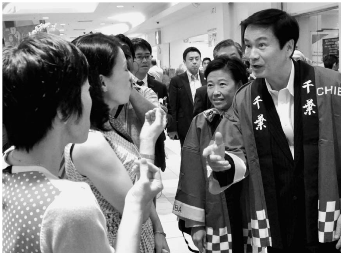
マレーシアで県産品をトップセールスする森田知事(2014年1月)

千葉県が大きく変わろうとしている。悲願だった東京湾アクアラインの割引継続が決まり、県内陸部を縦貫する圏央道も昨年4月以降、相次いで延伸。全線が開通すれば、東京都心を通らずに東北、北関東、千葉、首都圏を結ぶ新たな産業大動脈が完成する。空の玄関口である成田、羽田両空港へのアクセスも向上し、産業発展、経済成長への期待が高まる。「半島性からの脱却」という積年の夢をかなえ、次代に向けた成長モデルを描く千葉県産業の「これから」を探った。