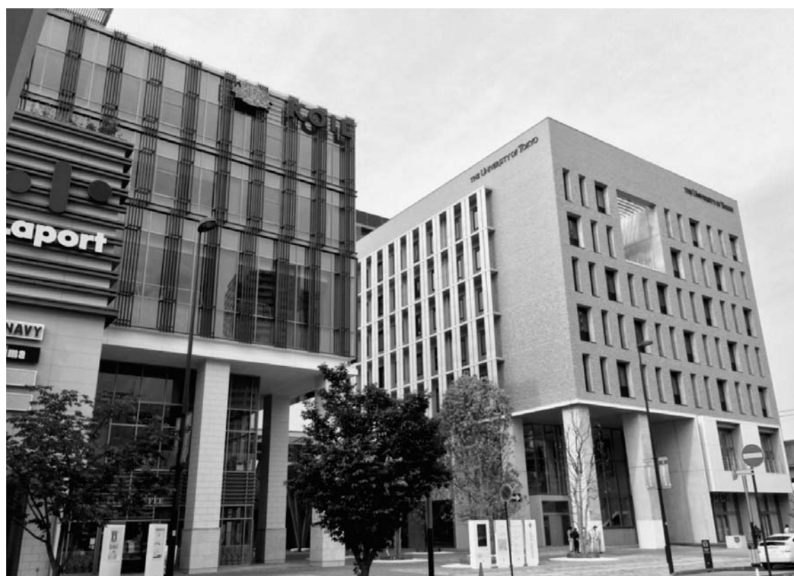
新産業創出への基盤が整う、柏の葉キャンパス駅前