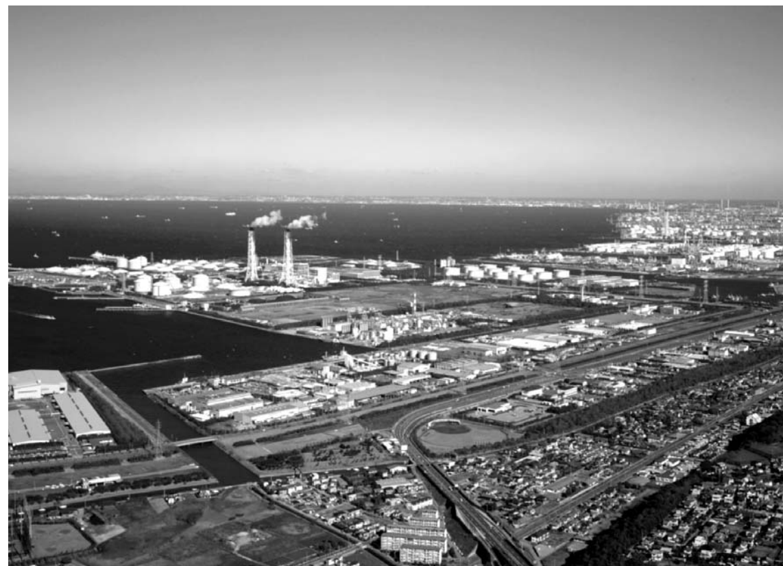
県経済の生命線、京葉臨海コンビナート

千葉県が大きく変わろうとしている。悲願だった東京湾アクアラインの割引継続が決まり、県内陸部を縦貫する圏央道も昨年4月以降、相次いで延伸。全線が開通すれば、東京都心を通らずに東北、北関東、千葉、首都圏を結ぶ新たな産業大動脈が完成する。空の玄関口である成田、羽田両空港へのアクセスも向上し、産業発展、経済成長への期待が高まる。「半島性からの脱却」という積年の夢をかなえ、次代に向けた成長モデルを描く千葉県産業の「これから」を探った。