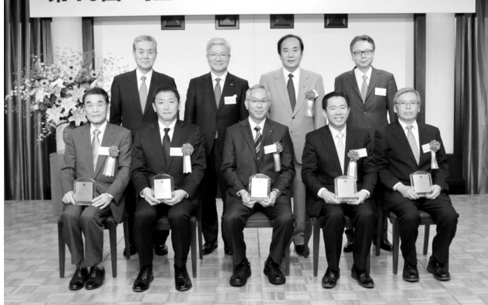
栄えある第10回受賞者