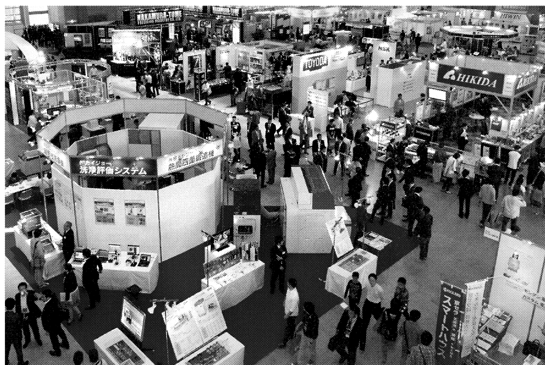
多くの来場者が詰めかけた前回のMEX金沢2013

今回の開催にご尽力された関係各位に深く敬意を表するとともに、本見本市に多くの皆様方がご来場され、大きな成果をあげられますことをご祈念いたしております。