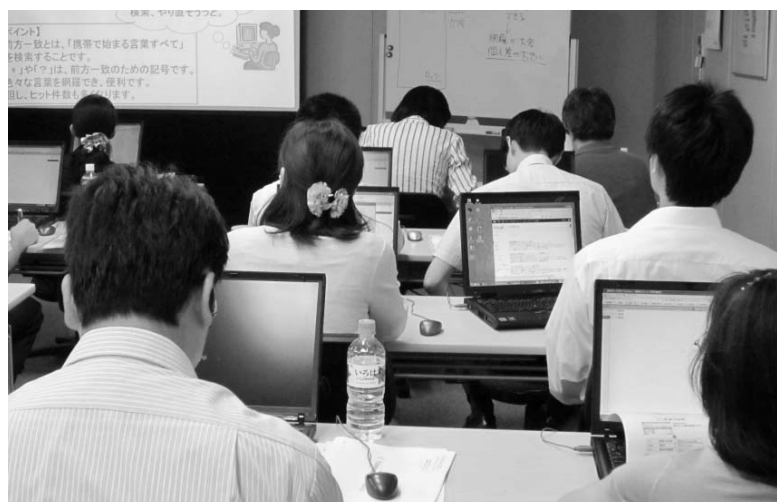
日本パテントデータサービスはセミナー事業にも注力する