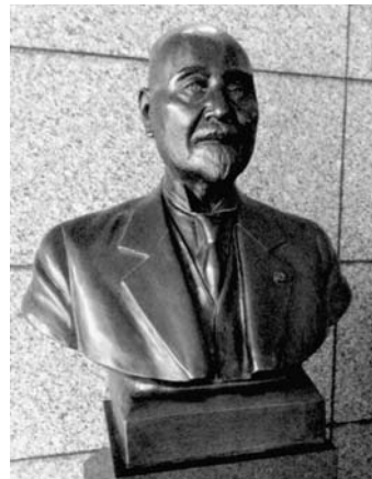
特許庁庁舎1階にある高橋是清の銅像

1885年（明治18）4月18日に、現在の特許法の前身である「専売特許条例」が初代特許庁長官を務めた高橋是清らによって公布されたに由来する記念日。特許、意匠、商標などの産業財産権制度の普及と啓発を目的に、1954年に制定された。歴史をたどると、高橋是清は1872年に役人になって以降、文部省（現文部科学省）で教育制度確立のため雇われていた米国人博士の通訳をしていた時に発明や商標の保護に遅れていた日本の状況を痛感し、多くの困難を伴いながらも同条例の制定にこぎつけたという。以来、産業財産権は日本の産業技術の発展の基盤になった。また現在、発明の日を含む1週間（2014年度は4月14日から20日まで）は「科学技術週間」として全国の研究機関などで、科学技術に対する理解と関心を深めるための多数の講演会、施設公開などが行われている。