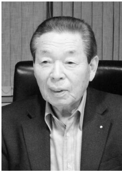
平和産業会長 NITEC埼玉産学交流会