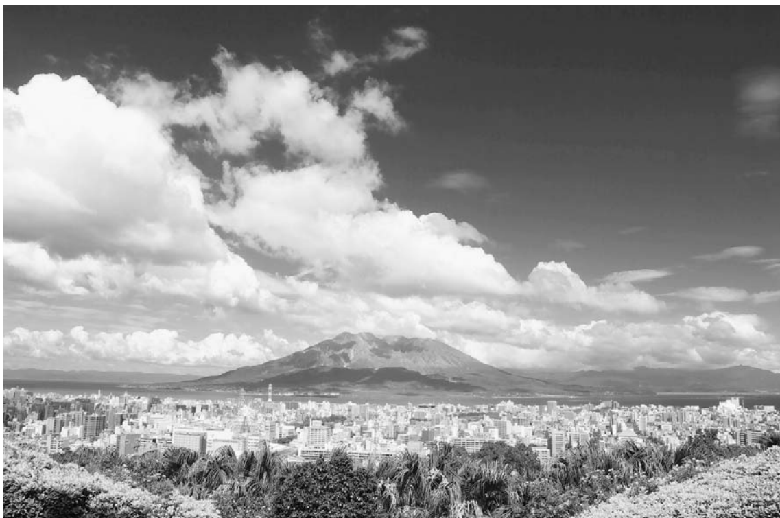
鹿児島のシンボル「桜島」