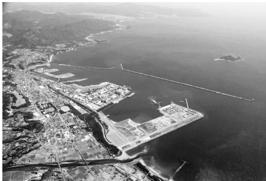
国際物流拠点 「志布志港」