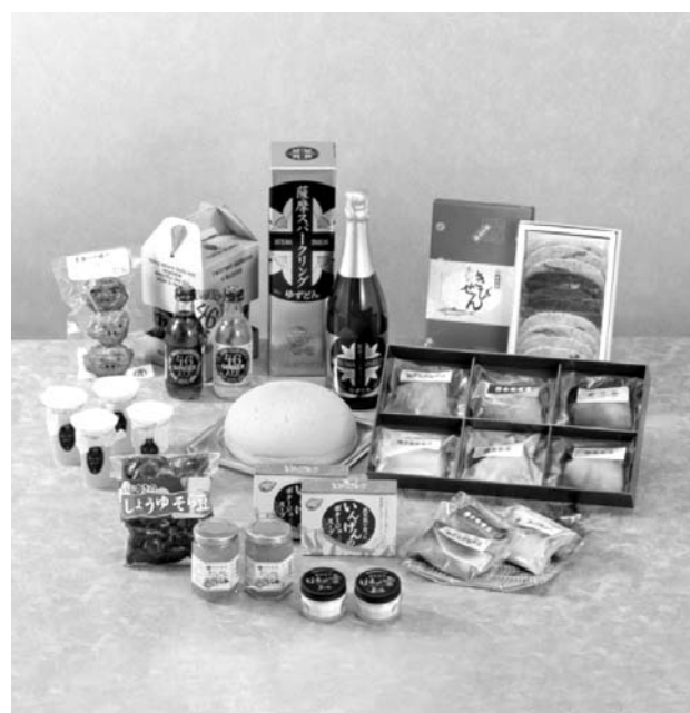
鹿児島県の特産品

県が管理している工業用地は、鹿児島臨海工業地帯1号用地(鹿児島市)、鹿児島臨空団地(霧島市)、国分上野原テクノパーク(同)、志布志港新若浜地区港湾関連用地(志布志市)の4カ所。1号用地は鹿児島市の中心部から約15キロ、鹿児島臨空団地は新若浜地区は国際海物流拠点の志布志港にあり、志布志港(霧島市)や九州自動車道のインターチェンジが近い。テクノパークは自然に恵まれた団地、新若浜地区は国際海物流拠点の志布志港にあり、志布志港(霧島市)や九州自動車道のインターチェンジが近い。テクノパークは自然に恵まれた団地、新若浜地区は国際海物流拠点の志布志港にあり、志布志港(霧島市)や九州自動車道のインターチェンジが近い。