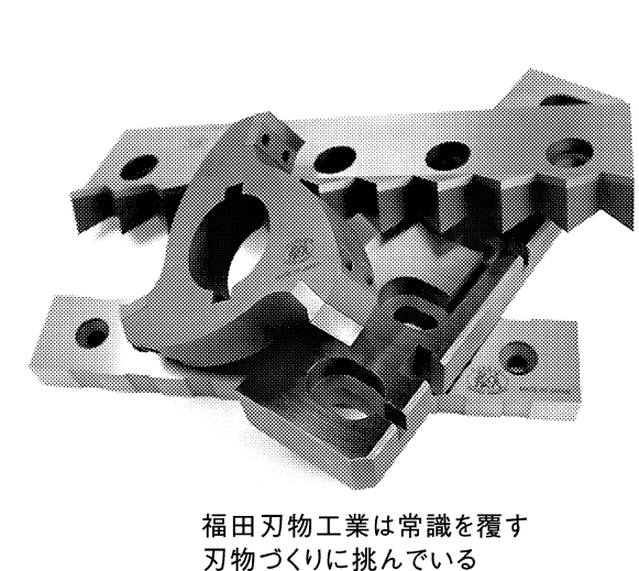
福田刃物工業は常識を覆す刃物づくりに挑んでいる

ツキオカフィルム製薬(各務原市)はフィルム状の下痢止め大衆薬「ティファ」を発売し、独自のフィルム製法で滑らかな服用感が特徴。同社はこれまでフィルム製剤を他の製薬会社に相手先ブランド(ODM)供給していた。だが、自社ブランドの医薬品の発売は初めての。同社は本業の箔押し印刷や食用金箔の事業の派生技術として蓄積したフィルム加工技術をベースに、食用フィルム、フィルム製剤と事業領域を二歩ずつ拡大してきた。社