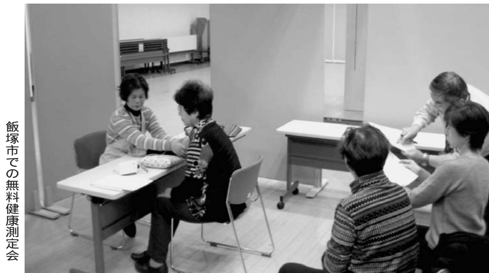
飯塚市での無料健康測定会

「70歳現役社会」を目指す福岡県の中心組織が「70歳現役応援センター」を福岡市博多区の「はかた近代ビル」と北九州市小倉北区の「近藤会館ビル」にオフィスを構える。12年4月開設の博多は12人、13年5月開設の北九州市は3人の体制で相談にのじる。そのほか久留米市と飯塚市では定期的に出張相談会を開いている。 センターは再就職に限らず、多様な選択肢を提案している。例えば福岡県高齢者能力活用センターやシルバー人材センター