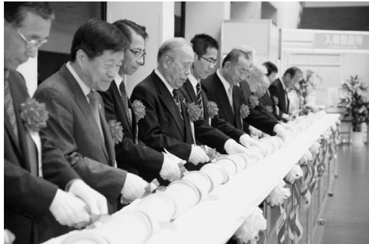
テープカットならぬケーキカットで開幕