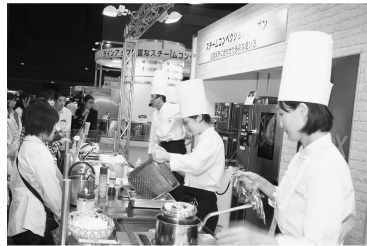
実演などを通じて「見て楽しい」食を発見できる

本。それぞれのニーズにマッチした学びの時間が用意されている(セミナーの聴講は事前予約が必要)。 西日本食品産業創造展で毎年PRしているイベント「サマーパレンティンデー」。2月4日のパレンティンデーに対し、サマーパレンティンは7月7日の七夕にあやかったイベント。七夕祭りとして親しまれている織り姫と恋する星の物語にちなみ、恋人、夫婦や親子、親しい人やお世話になった人たちに、お互いの感謝の気持ちを込めて贈り物をしようという運動だ。各地の菓子店や包材メーカーが積極的な動きをみせており、イベントを盛り上げている。発祥の地である福岡を皮切りに、東京、大阪、名古屋などにも広がりはじめていく。 西日本食品産業創造展で行われる「サマーパレンティンエクス」は今回で7回目。サマーパレンティンをモチーフにした弁当や商品、ラッピンググッズの展示に加え、キャラクタークッキーの試食などもある。