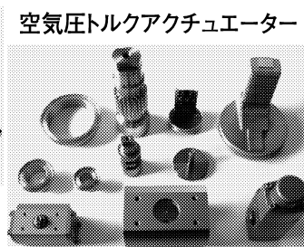
空気圧トルクアクチュエーター