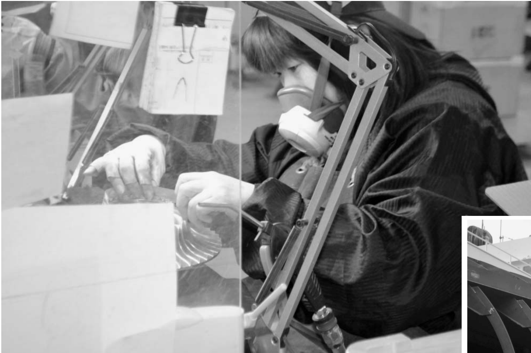
相馬ブレードは震災から2カ月後に創業を再開し、3年経った今、復興への道をしっかりと歩んでいる