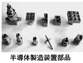
半導体製造装置部品