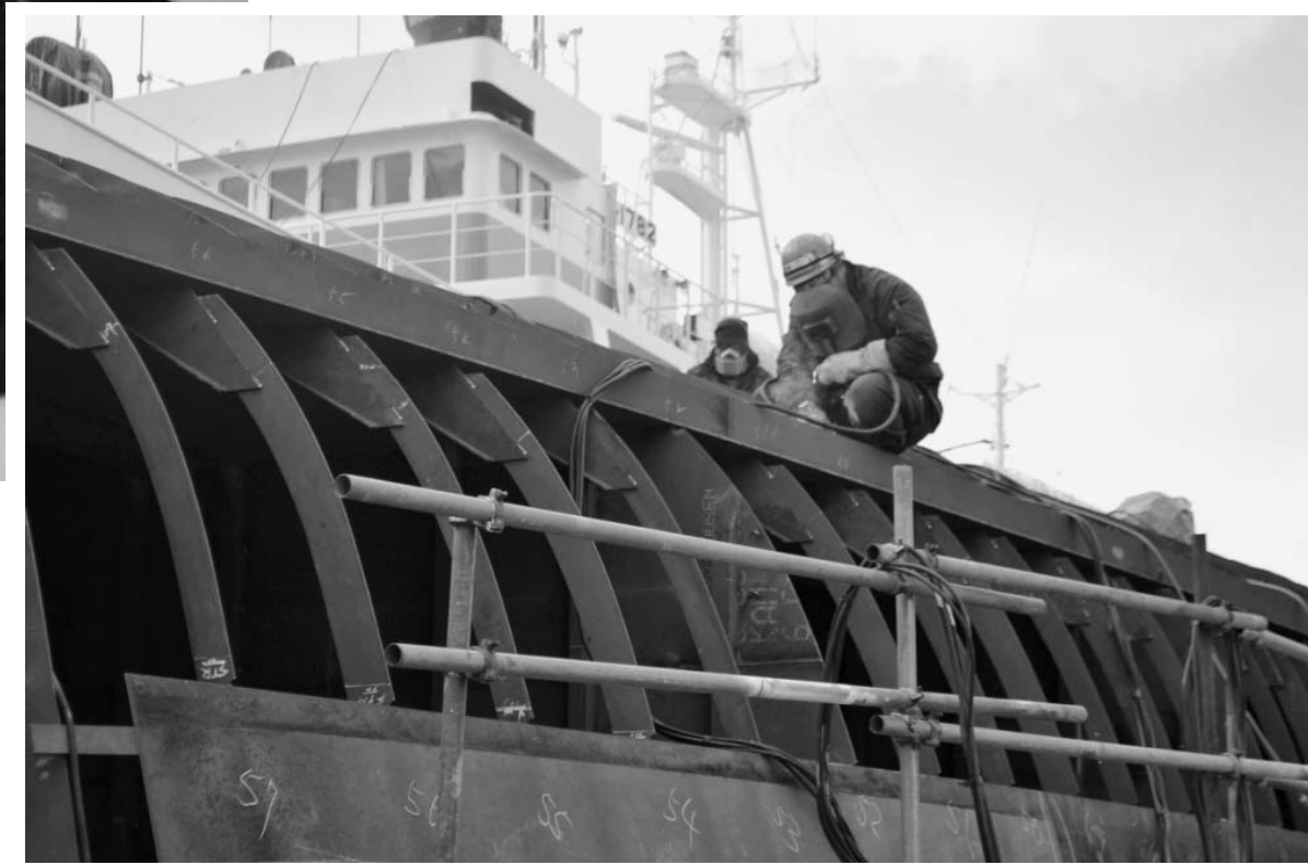
宮城県気仙沼市の木戸浦造船では、大型漁船の新規建造が進む ▶

東日本大震災から3年がたった。内閣府によると経済被害額は約16兆9000万円、死者・行方不明者は2万1440人(14年1月10日現在、震災関連死亡含む)。今も約28万人が仮設住宅などで避難生活を続けている。政府は被災地のインフラなどの復旧を急ぐ一方、地域経済を支える産業に対する手厚い支援を実施してきた。ただ復興までの道のりは厳しく、目の前の一つひとつの壁を乗り越えながら、新しい東北の創造に向けて走り続けている。