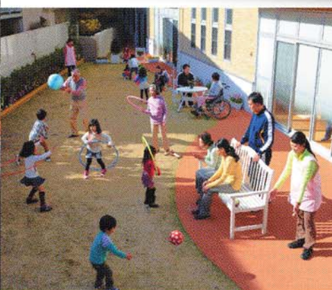
ジェクサー・ プラチナジム 南浦和