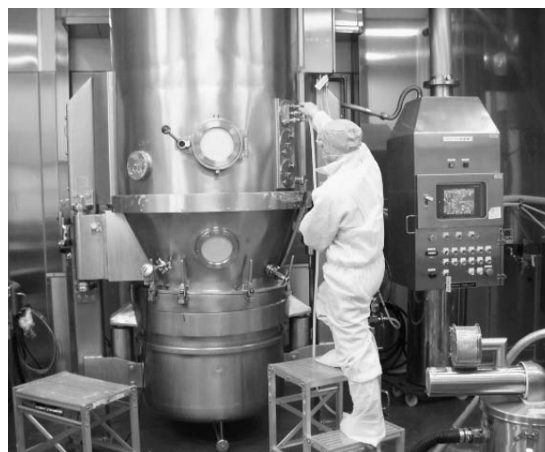
CMOの重要性は高まっている(武州製薬)

長期収載品 ジェネリック(後発薬)、一般用医薬品(OTC)など製薬企業が扱う製品が広範囲になる中、研究開発にコスト、人材を注力し新薬を創出するために、医薬品製造受託機関(CMO)への製造委託が増加している。CMOは製造だけでなく、創製や包装デザイン、原料調達などの改良・改善を提案し、製造コストの削減、医薬品の品質向上に貢献する。CMOビジネスの定着、国際化など業界の活性化に向けた取り組みが進められている。