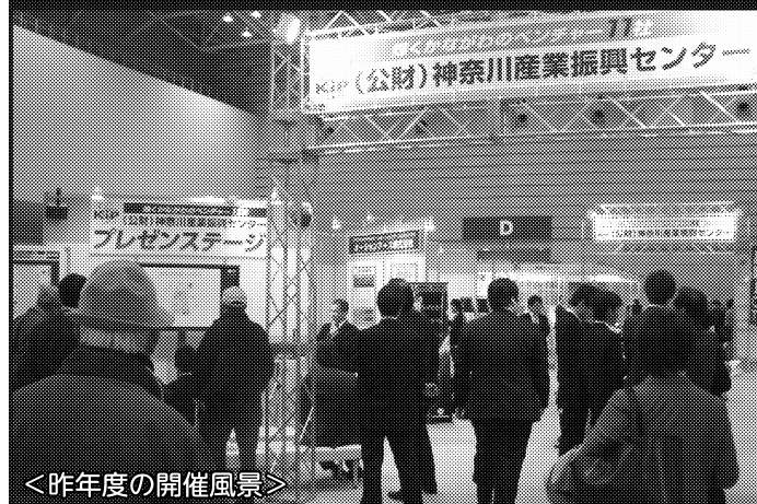
＜昨年度の開催風景＞