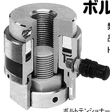
ボルトテンショナー

弊社横浜エンジニアリングサービスはHydratight社製品を取り扱う国内唯一の代理店です。販売だけでなく、Hydratight社製品の修理・校正作業も行っております。