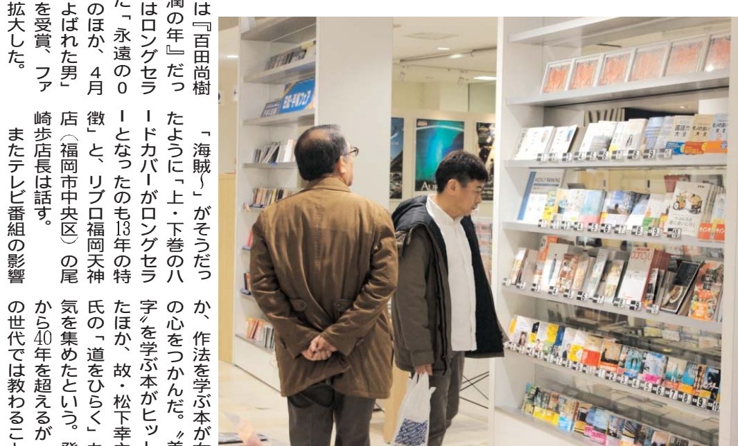
「百田」「池井戸」に続くヒット作家は誰か...

13年の本は「百田尚樹」と池井戸潤の年」だった。百田氏はロングセラーとなった「永遠の0」（ゼロ）のほか、4月に「海賊」とよばれた男」が本屋大賞を受賞、フアンを一気に拡大した。 「海賊」がそうだったように「上・下巻のハードカバーがロングセラー」となったのも13年の特徴。このほか、松本幸次郎氏の「道をひらく」も人気を集めたという。発行から40年を超える「今」の世代では教わる「友田グループ」長だ。 官公衛に開通して人気を集めた時代小説だが、14年は新たな展開が見られた。これまでミステリーやファンタジーで活躍していた垣根涼介氏や万城目氏などが相次いで時代小説を出版。「時代小説には縁がなかった若者や女性までファンを広げよう」（友田グループ）長だ。