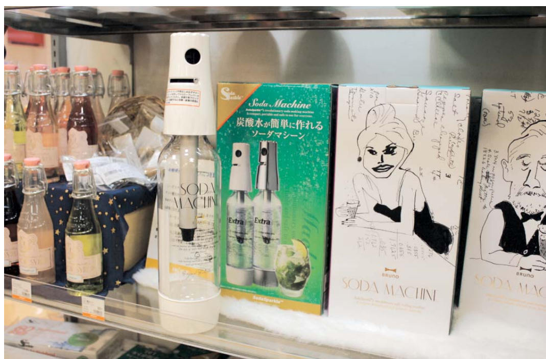
パッケージが違っただけで売り上げが増えることも（ソーダマシン。左が古いパッケージ、右が新しいパッケージ）

「アベノミクス」が流行語となった2013年。ただ、景気回復は全国隅々まで浸透していないとの声も。14年は、皆が景気回復を実感できるのか。身近な消費財の最前線を訪ね、新しい年のトレンドを占う。