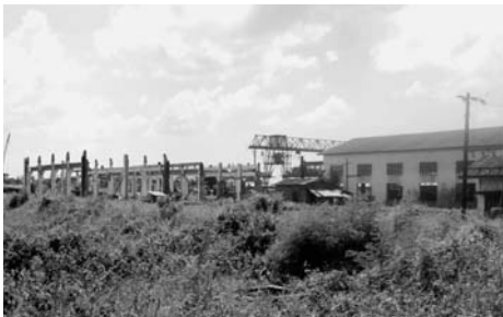
ミャンマー合併の新工場建設予定地(ヤンゴン市内=JFEエンジニアリング)

JFEエンジニアリングのミャンマー橋梁事業が新たな段階に入る。ミャンマーの建設省と合併会社を設立する。橋梁など鋼構造物を年1万トン製作。工場はヤンゴン市内に2014年4月操業。(7面)