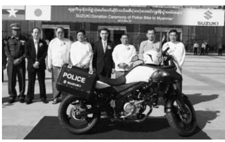
スズキはミャンマー政府に警察用2輪車を寄贈

スズキは、ミャンマー政府に警察用2輪車を100台寄贈した。ミャンマーで開催される国際的イベントで、要人警護などに使用。650ccの大型2輪車「Vストローム650ABS」がベース。(3面)