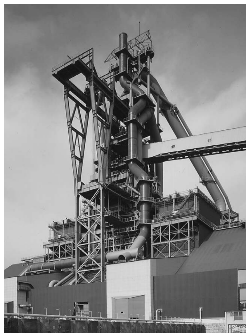
神戸製鋼所加古川製鉄所の2号高炉

能にし、タッチパネル式で操作性を高めた。製鉄所やタイヤ・ゴム工場などの生産ライン向けで年間1000台の販売を目指している。ミヤシタ(加古川市)では01年に発売した竹炭をコンテナーリングした足袋型パンをテストマーケティングがロングセラーを続けている。最近10年間の累計で約5万4000台に達している。暖かく、消費や抗菌などの効果もあるのが理由となっている。高砂産業(高砂市)は大阪市立デザイン教育研究所(大阪市阿倍野区)の学生デザイナーと連携、14年3月を境に地下足袋の自社ブランドを立ち上げる。連携によってファッション性を高めることで従来のOEM先以外の一般向けにターゲットを拡大する。高砂産業は高輝度の蓄光材を高透過ガラスに組み込んだ「ムーングラスボール39ST」を発売した。光を遮断して1時間後の残光輝度が安全標識に必要なJIS規格の最低輝度の10倍明るく約8時間光り、夜間の衝突防止や災害時の避難誘導に役立つ。色は2色で直径39mmの半球型、壁面に両面テープで簡単に貼り付けられる。