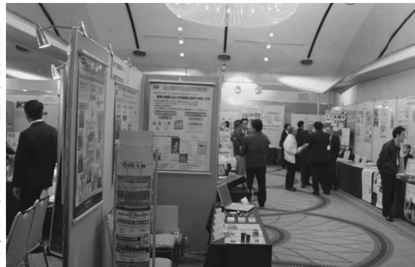
東播磨ビジネスマッチングフェアの会場(10月22日)

ここに挙げた例をはじめ、大手に頼ることなく独自の技術と製品を展開する中小企業は、東播磨には他にも数多く存在している。そんな中小を後押ししようと兵庫県東播磨県民局、加古川市、加古川商工会議所が主催するイベント「東播磨ビジネスマッチングフェア」が10月22日に開催された。2009年から今年で5回目となるが、そのテーマ