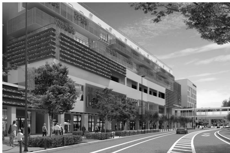
ゲートスクエアのショップ&オフィス棟に、起業家支援施設KOILが入居する