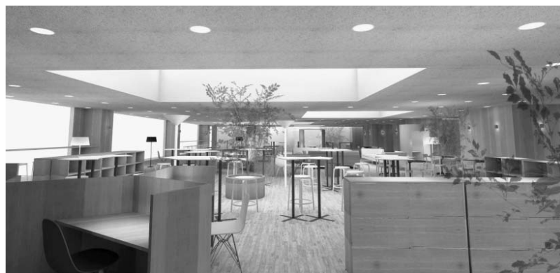
KOILのイノベーションアイディアは開放的な設計。誰もが交流し、アイデアを持ち寄れる空間にして、事業の創造と加速を促す

三井不動産が柏の葉キャンパス駅前に造成している「148街区」の全貌が、9月明らかになった。住宅やホテル、大学に隣接する「ゲートスクエア」に、起業家支援施設KOILが入居する。この地区は、三井不動産や東京大学、千葉県などによって開発されている。「柏の葉スマートシティプロジェクト」と題した三井柱の発想による「世界の未来像」をつくる街をキーワードに、街は今、ソフト・ハード両面で挑み続けている。