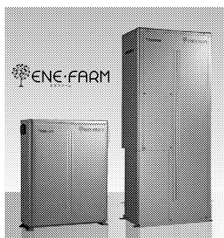
※「エネファーム」は登録商標です。

エネファームは自宅で都市ガスを使って電気とお湯をつくり、エネルギーを無駄なく、効率的に使う最先端のエネルギーシステムです。