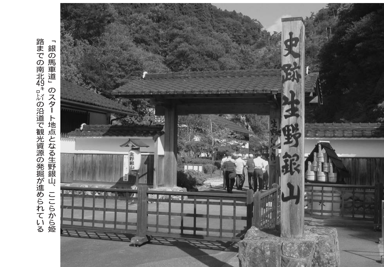
「銀の馬車道」のスタート地点となる生野銀山。ここから姫路までの南北49キロの沿道で観光資源の発掘が進められている。