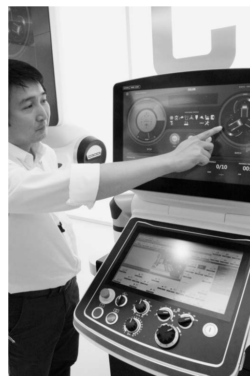
DMG森精機の新OS「セロス」