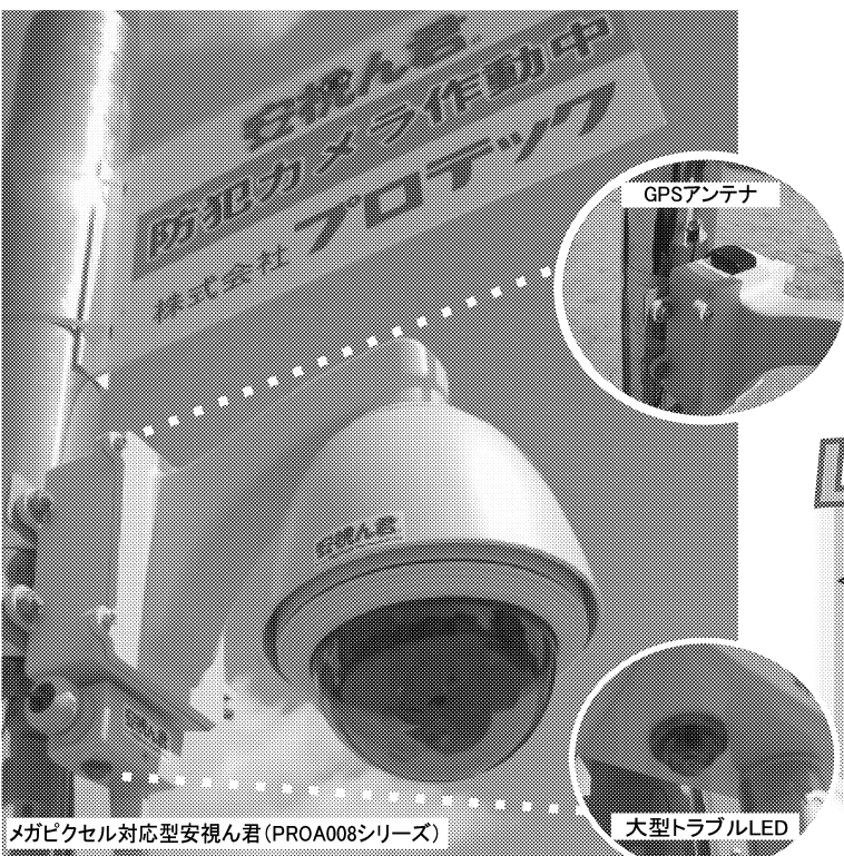
メガピクセル対応型あんしん君 (PROA008シリーズ)