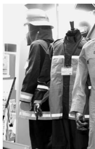
危機管理に対する全ての分野を網羅する(危機管理産業展2012より)

また、最新の消防車両を展示する他、ポンプ車や民に危機管理の重要性を伝える。防災エリアでは帰宅支援ツールや救助資機材、救急医療資機材、災害監視システムなど地震、火災、水害など幅広い災害に対応する製品を展示する。リスク管理エリアではヒューマンエラー対策システムや緊急通報シス