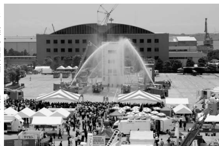
東京消防庁は屋外に特設会場を設け、消防演技を行う(東京国際消防防災展2008より)

では東京消防庁や消防団による一般火災演技や、近隣消防本部・横須賀米海軍消防隊などによる合同震災救助演技を行う。