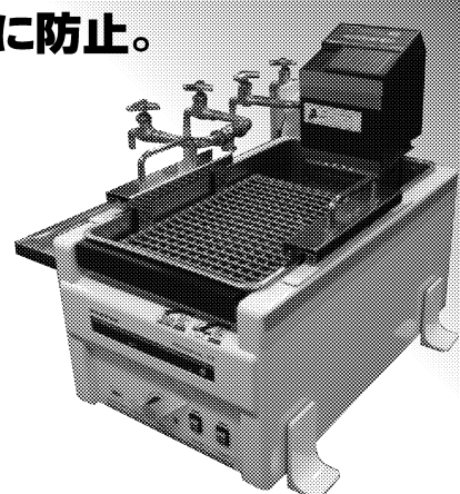
▲計測機器への設置例