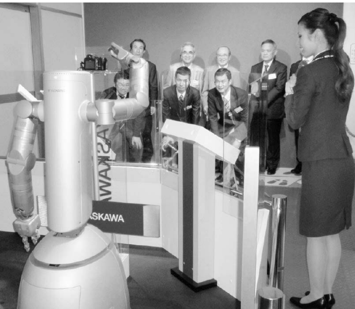
安川電機でロボットを見学