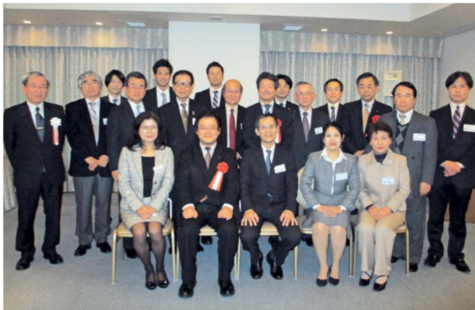
昨年3月22日に30番目のクラブとして誕生した大分産業人クラブ(設立記念集合写真)

「産業人クラブ」は、地域産業の結束を通じてモノづくりを中心としたわが国の産業の発展に寄与することを目的に設立した異業種交流組織。1955年11月に東京で発足した「日本工業会」、58年2月に名古屋で発足した「名古屋工業倶楽部」を前身とし、64年4月に埼玉、栃木、千葉、茨城などで相次いで誕生した「工業人クラブ」が現在の産業人クラブの基礎をつくった。現在、産業人クラブは全国30組織(13年8月1日現在)のネットワークを形成し、1800人の会員が参加する全国組織に成長している。会員同士が強い絆で結ばれた組織として日本の産業の発展の一翼を担っている。