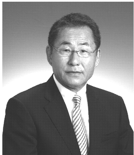
八代市長 福島 和敏

八代市は港を中心に栄えてきた街であり、今後も間違いなく八代港とともに発展していく都市である。八代港は物流のみならずクルーズ船など人流通においても地域活性化や雇用創出において大きなメリットをもたらす最大の公共インフラであり、市にとっては「命である」。昨年「外に向かつて打って出る」を旗印に、九州の中心である地の利を活用した港湾振興策を強化を進めてきた。特に2010年に国の重点港湾に選定されたことを機に市役所内に「重点港湾八代港営業隊」を設置した。この2年間で国内外間を往復する船舶が1000社以上の企業を訪問し、八代港を売り込んでいる。その結果、八代港のコンテナ取扱量は、ここ2年で20%以上の大幅な伸びを示している。