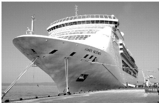
12年に入港したクルーズ船「コスタ・ブリティック」

熊本市八代市は南九州の拠点都市。九州新幹線の新八代駅、九州自動車道の八代インターチェンジ、八代港がある。八代港は2010年に国の重点港湾に選定された。大型船に対応する岸壁が整備され機能強化が進む。クルーズ船の入港や国際コンテナ航路の新設もあり、存在感を増している。さらに利用を促進しようと県と市は営業や助成に力を入れる。