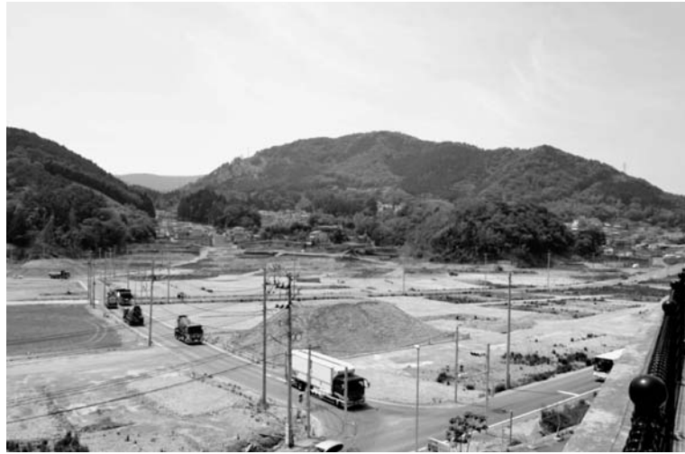
街の再建スピードアップが期待される（宮城県女川町）

大林組は港湾空港技術研究所（港空研）などと共同で、海底から浮上して津波を防ぐ可動式防波堤を開発した。国土交通省は2020年までに和歌山下津港・海南地区（和歌山県海南市）入り口の航路部分に総延長2300mの可動式防波堤を整備する計画で、まず実証実験を兼ねた約10分を先行発注。3月下旬の動作試験で、海面下約13・5mから海面上約7・5mまで10分以内に浮上した。