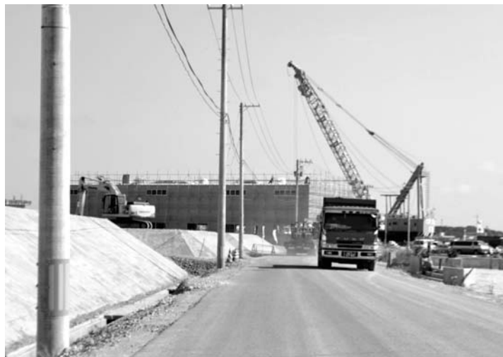
土地のかさ上げ工事が進む宮城県気仙沼市