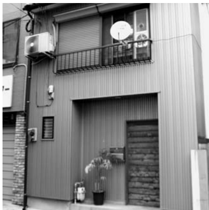
④民家のようなたたずまいの博多図工室 ⑤国産3次元プリンター

ここまで主に福岡市中心部のワーキングスペースを中心に紹介したが、だが都市生活にこだわらない働き方もノマドと定義される。自然豊かな郊外や田園地帯を仕事場にするスタイルだ。そのような移住を呼ぶが、福岡県と筑後地域12市町で構成する筑後園都市推進評議会が、あつたという。は「ちくこ」に移住計画」は、条件が良い仕事をしたい、選んで身一つで渡り歩きたいというスタイルがあつた。ビジネスパーソンも同じで、場所や部署、職業、世代など何かしらの移動を繰り返して生きていく。ネットの進化で働く環境が激変した部分はあある。だが最後はそれぞれの働く姿勢やスキルがカギになる。ノマドということなく、便利な場所やリールを活用しながら「生きる道」を探していくことに変わりはなく。