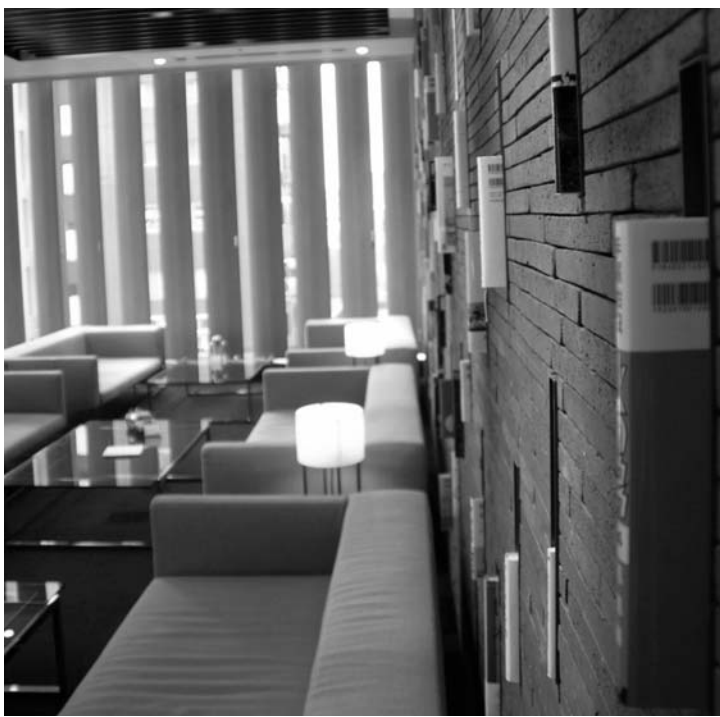
⑤ヒスコリはこだわりの内装で、くつろぎとインスピレーションを提供 ⑥蔵書は20万冊以上

新しい働き方として「ノマド」という言葉が聞かれるようになった。もともと遊牧民を表す英語で、その定住しない生き方から、組織に属さずオフィスを持たない自由な働き方を表すようになった。概念は広く、フリーランスの働き方や企業人の効率的な仕事術も範囲に入る。ここではノマドを自認する人もそうでない人も、仕事の能率向上やビジネスチャンスのきっかけになるかもしれない「仕事場」を見ていこう。