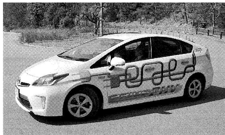
サブライヤーとして選ばれるために、技術開発の重要性は増している(写真:トヨタプリウスPHV)

部品メーカーがサブライヤーとして選ばれるために、技術開発の重要性は増している(写真:トヨタプリウスPHV) 部品メーカーがサブライヤーとして選ばれるために、技術開発の重要性は増している。自動車業界では、グローバル化に伴い、よりよい製品をより安く全世界に提供し、お客さまに満足していただくことが求められている。自動車部品業界では、グローバル化に伴い、よりよい製品をより安く全世界に提供し、お客さまに満足していただくことが求められている。