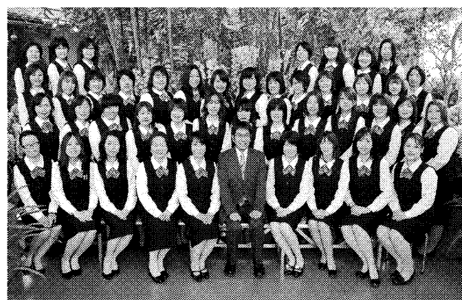
※毛髪診断士…公益社団法人 日本毛髪科学協会認定

「まごころ」を込めて 一生懸命 考えました。 私共は頭髪のことでお悩みの方に「新しい蘭夢」をどのような方法で使いついていただくのが良いかを考えました。 「あう」あわなないがある育毛剤だからこそ安心してお試しください。髪について様々なお悩みを持つ方々に対して私共50名の毛髪診断士の資格を持つスタッフがそのお悩みの解消に向けて誠心誠意お手伝いさせていただきます。私共のまごころを込めた姿勢をどうぞご理解いただき、まずはこの一本で「新しい蘭夢」をご実感ください。