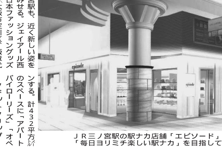
「JR三宮駅の駅ナカ店舗「エピソード」の完成イメージ。毎日ヨリミチ楽しい駅ナカ」を目指して整備が進んでいる

神戸市は「JR三宮駅」を13年度内にまとめた「駅前再整備事業検討会」を設け、2013年度予算には1300万円を計上し、06年から勉強会という形でJR西日本と市が意見交換していたのを、今年度から検討会に格上げ。駅ビルの建て替えも含めて、コンコースや駅前広場など駅前の共有スペースの再整備の仕方について検討する。現状の人の流れなどを調査し、検討に生かす計画だ。神戸市の担当者は「JR西日本と協調して適切な再整備ができるよう検討したい」と話す。一方、神戸産業界も三宮周辺の再開発について構想をまとめる動きがある。神戸商工会議所、神戸経済同友会、神戸青年会議所は共同で、12年度に「神戸海都市づくり研究会」を設けており、都市づくり全般について調査研究してきたことをベースに、神戸商工会議所は、三宮駅周辺の活性化策(第一次