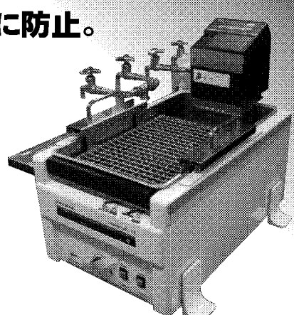
▲計測機器への設置例