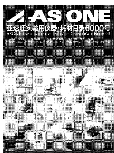
亜速旺実験用儀器・耗材目録 6000号

2013年5月発行! 13,000種以上の品揃え! 豊富な在庫で迅速納品! カタログ掲載外の商品にも対応致します!