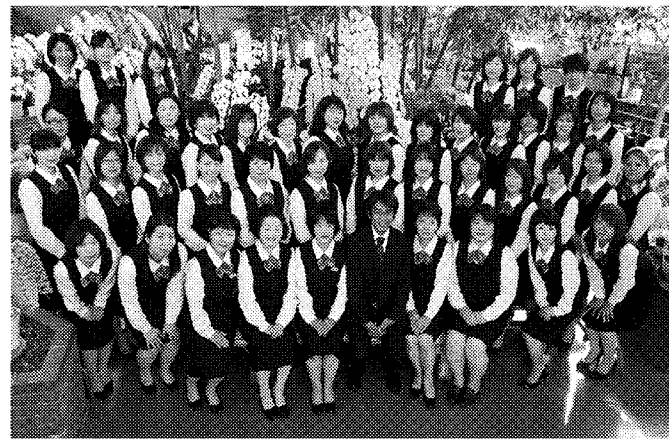
※毛髪診断士…公益社団法人 日本毛髪科学協会認定

一生懸命 考えました。 私共は頭髪のことでお悩みの方に「新しい蘭夢」をどのような方法で使いついていただけるかを考えました。「あう」「あわない」がある育毛剤だからこそ安心してお試しいただく為、この方法を考えました。髪について様々な悩みを持つ方々に対して私共50名の毛髪診断士の資格を持つスタッフがそのお悩みの解消に向けて誠心誠意お手伝いさせていただきますと存じます。私共の姿勢をどうぞご理解いただき、まずはこの一本で「新しい蘭夢」をご実感ください。