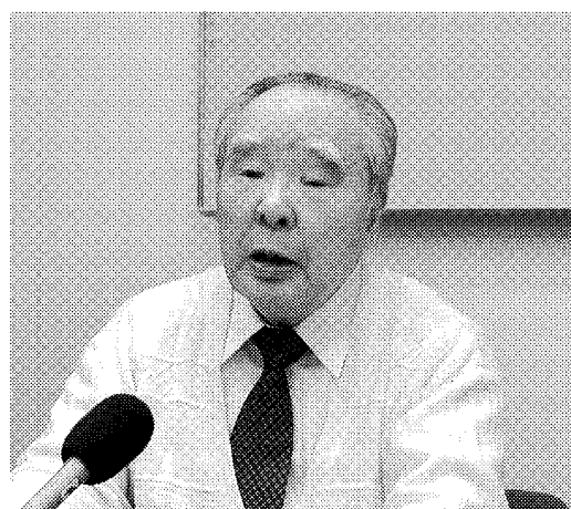
鈴木修スズキ会長兼社長は浜松市内で会見を開き、震災対策で5億円を寄付すると述べた

自動車関連メーカーの現地工場に納入する。日本プラストは8月をめどに、メキシコ・ケレタロ州に自動車用ハンドルの新工場を建設。既存工場と合わせたメキシコ全体の生産能力は、11年比約70%増の200万台に増強し、日産自動車などへ供給する。 ホンダは日産自動車の米国とメキシコの工場に納入する。投資額は15億円。キャタラー(静岡県掛川市)はインドネシア工場(2輪車向け排ガス浄化用触媒の生産を始め