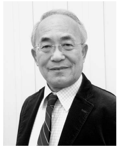
公力夕屋社長 (四国産業人クラブ)