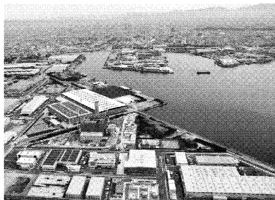
堺市は内陸部への企業投資も推進している