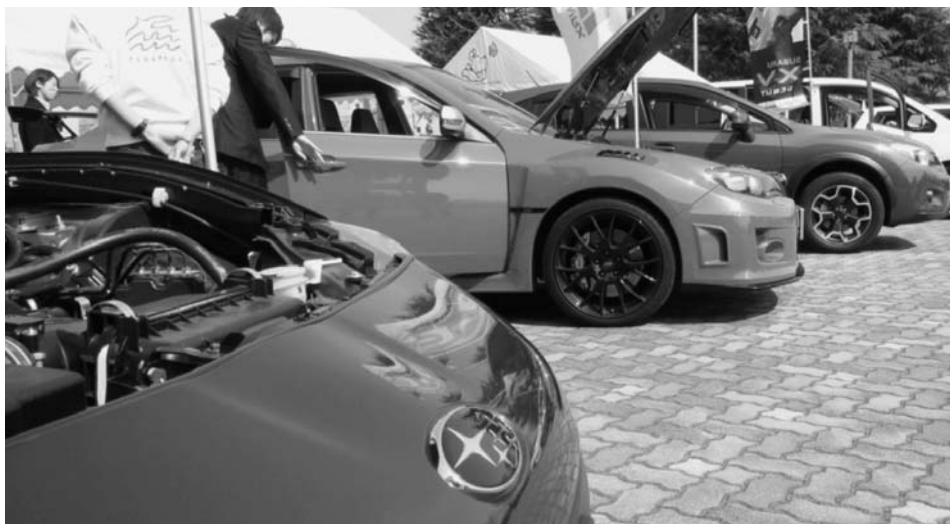
自動車産業を中心に生産活動が回復傾向にある群馬県

成長のきっかけをつかむには、1社単独でなく産学官金が一体となって新産業を興す動きは欠かせない。 「太田市 北関東が持つ潜在能力を連携して發揮したい」。群馬大学工学部の黒田真一教授はそう強調する。3月に生産システム工学科（群馬県太田市）が主導して、群馬大学ブレイクスルーテクノロジー「研究会」を立ち上げた。企業や団体が手を組んで素材の開発から販路の開拓、人材育成などの目的は幅広い。具体的なプロジェクトは①「ググテナマリール」②「ヒューマン サポート」③「メディカル アプリケーション」。 マグネシウム合金や植物