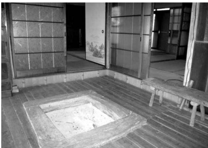
県内の自治体は古民家などの空き家を企業のオフィスとして貸し出す