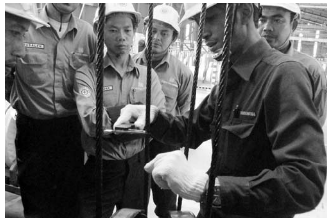
他社メーカーのユーザーも参加可能な安全講習会は現地でも好評を得ています (PT. KITO INDONESIA)