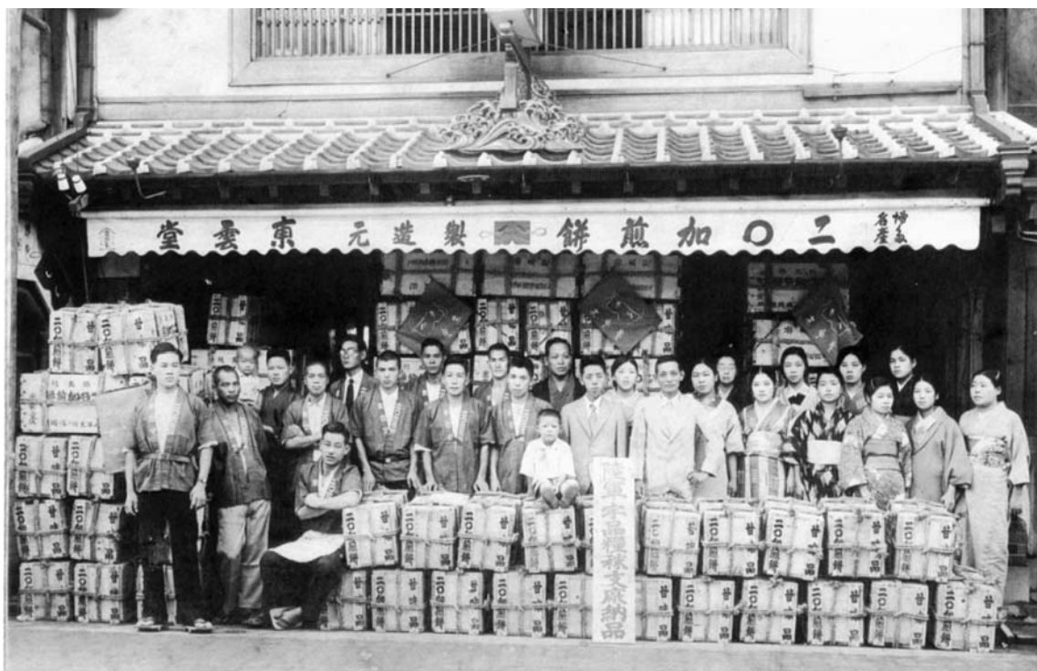
満州に向け出商前の店頭—1932(昭和7)年頃