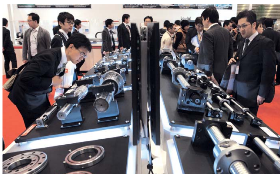
新製品への品定めにも熱が入る(JIMTOF2012)