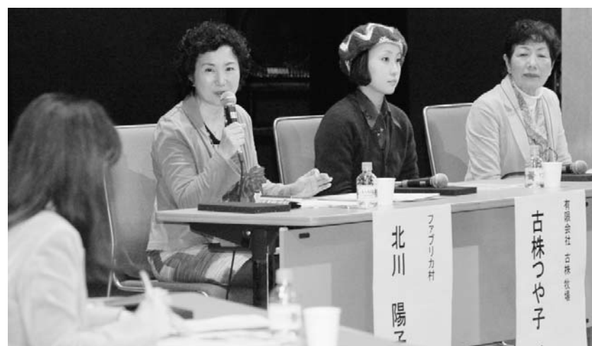
元気ビジネスの源泉は自然、文化、歴史など滋賀県の恵み、地域資源にある(中小機構フォーラム)