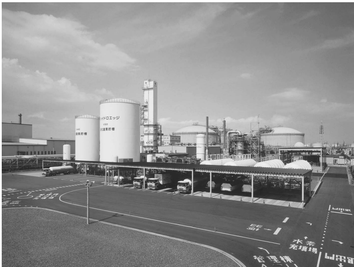
岩谷産業の国内最大の液化水素製造拠点(堺市西区)

と水準の値上げが全国に波及すると、08年と比べて業界全体で250億円の負担増になると日本産業・医療ガス協会は試算する。それだけに価格転嫁は避けられないが、顧客の経営環境を考えると厳しい。(日本産業・医療ガス協会の豊田昌洋会長)のも事実だ。(本文、次ページ下段に続く)