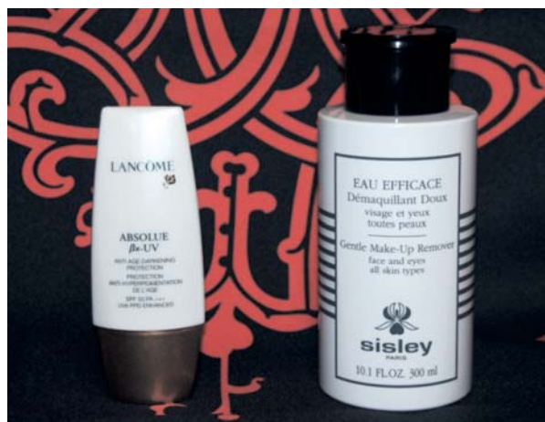
ランコム・アブソリュ x UV(左) シスレー「オーエフィカス」(右)

機能に妥協しない効率性。BBクリームに始まった多機能化粧品ブームが高級ブランドに広がっている。ランコム・アブソリュ x UV(30ミリリットル)は下地、ファンデーション、アンチエイジングを一本でこなす日焼け止め用乳液。SPF50/PA+++で、紫外線カットはもちろん、薄づきのファンデーションになるため忙しい朝に重宝する。各化粧品をそろえるよりも価格面でも効率的だ。 シスレーのオイルインワン・クレジシングウォーター「オーエフィカス」(300ミリリットル)は「ふきでクレジシング、洗顔、化粧水の3役を一本で完了する優れたもの。キャップを開けたボトル上部はポンプ式で、コトコトで押さえれば自然に染み出すなど」とことん手軽だ。 岩田屋本店(福岡市中央区)の化粧品担当バイヤーの武藤美和さんは「家事に仕事にと忙しい生活の中に、自分の時間を持ちたい現代女性のニーズを反映している」と分析している。