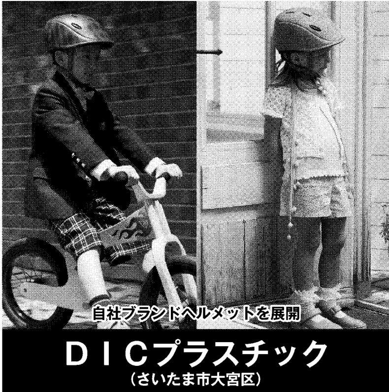
自社ブランドヘルメットを展開