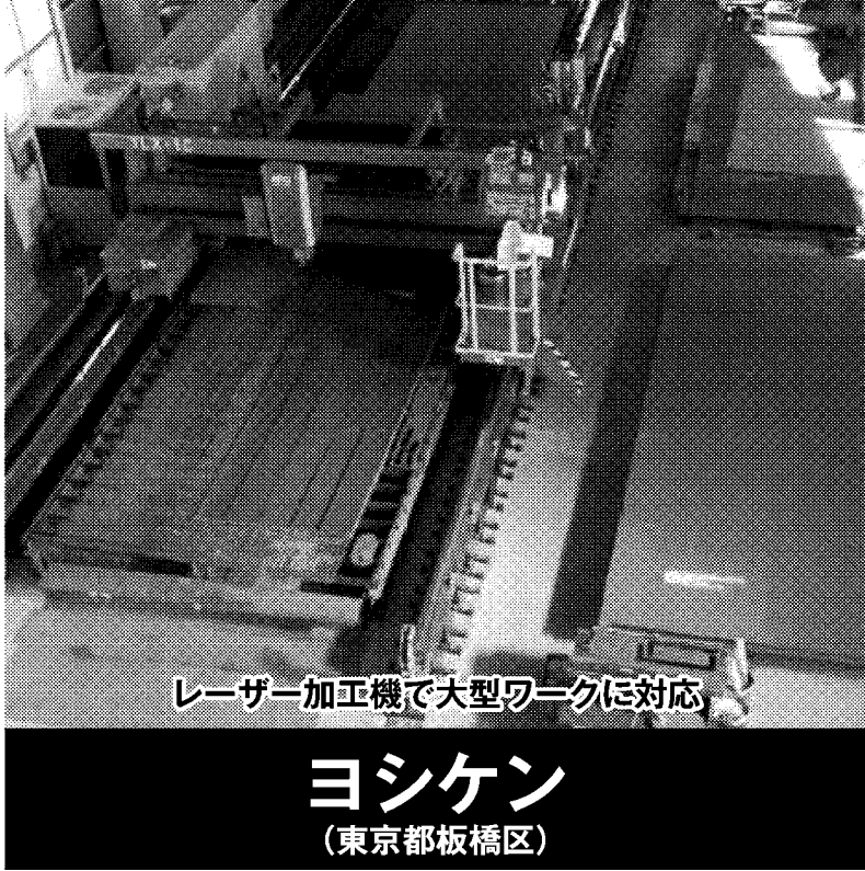
レーザー加工機で大型ワークに対応