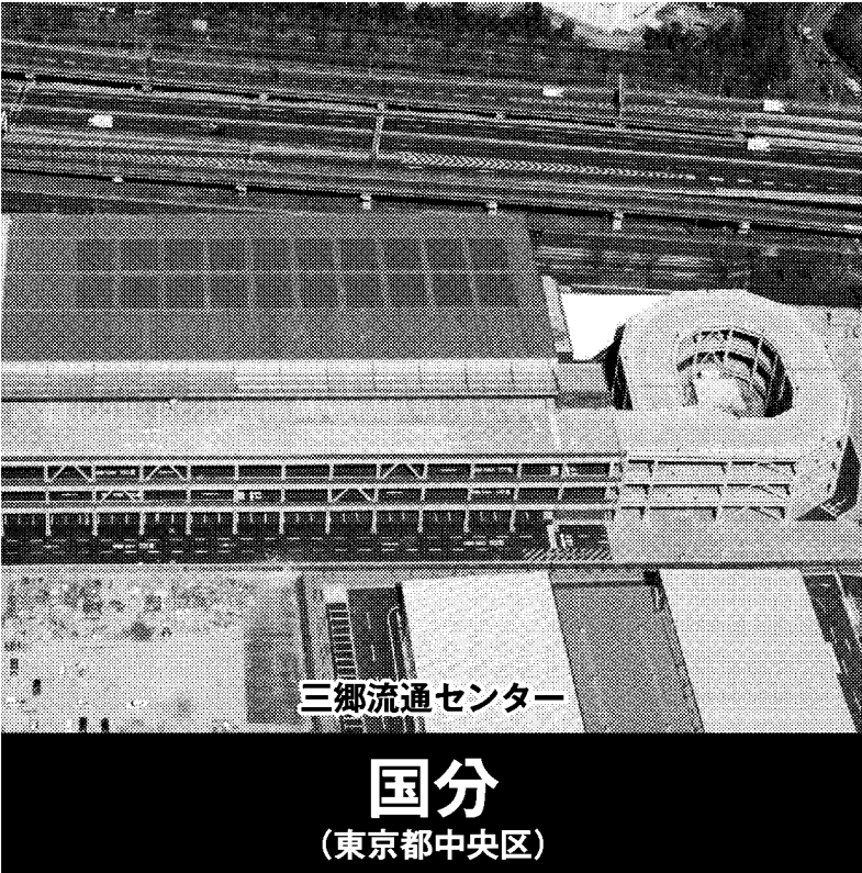
三郷流通センター