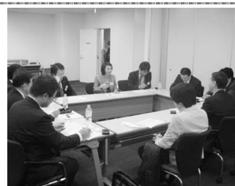
活気あふれる若手経営者の会