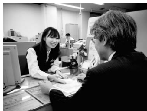
顧客に満足感をプレゼント