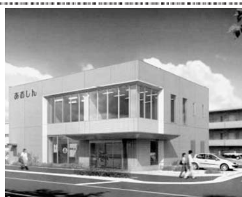
新南浦和支店の完成予想図

激戦区。同2号店出店を目指すには、1号店の業績を良く見据えてからのタイミングとなりそうだ。現在、融資に伴うコンサルティング能力の向上に努めている。財務分析や、在庫状況、売り掛け、買い掛けなどのデータから見た経営分析能力の向上が狙いだ。金融商品扱い拡充のため8カ所にファイナンスセンターを開設。うち6カ所は女性が部門長を務めるなど戦力の多様化を進めている。