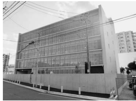
さいたま市大宮区の事務機能センター

同金庫では今年度、各支店で「課題把握シート」の作成を開始。決算書に表れない各顧客の情報を項目別に整理し、課題解決に導いている。9月末までに約2,000シートを作成。通期3,000シートを目標としている。13年3月には中小企業金融円滑化法が終了する。これに対し同金庫は、終了後も姿勢を変えない方針。「従来通り真摯に対応する」（同構え）としている。